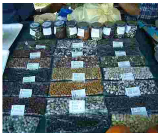
Las diferentes variedades de ñunas, fueron también una de las especies vegetales que destacó en el “VI Festival de la Agrobiodiversidad”