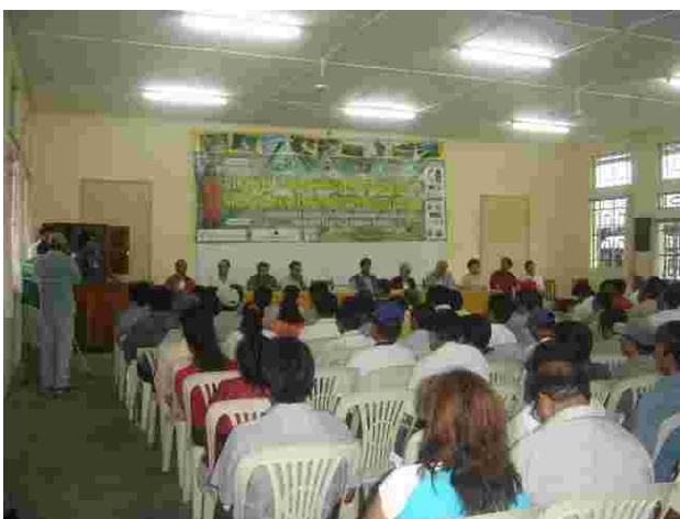
Inauguración del “XI Encuentro Nacional de Productores Ecológicos del Perú”, dando inicio al día de conferencias magistrales

En este espacio se dio la presentación de las conferencias magistrales nacionales e internacionales a cargo de profesionales con experiencia en el tema. Aquí se abordaron temas enmarcados en tres grandes ejes temáticos, lo que implicó el desarrollo de los mismos en tres ambientes a tiempos paralelos