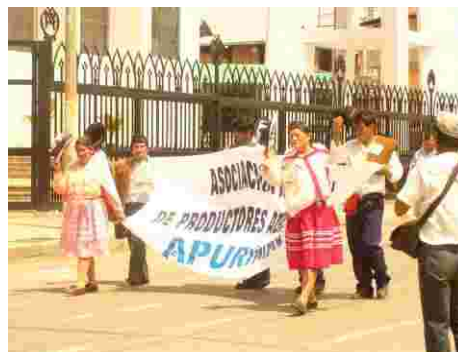
Las delegaciones de Huancayo (izquierda) y Apurímac (derecha) desfilando frente a la tribuna principal el día del desfile.