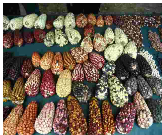
Diversidad de colores y usos en maíces nativos Provenientes de la zona andina.

Concurso de la Agrobiodiversidad: Se convocó y realizó un concurso para premiar y otorgar reconocimiento a las personas que hacen conservación y preservan la agrobiodiversidad. Para ello se efectuó una categorización de productos más representativos de la agrobiodiversidad peruana, concluyendo en la siguiente clasificación: papas nativas, maíces nativos, otros tubérculos nativos, granos andinos, frutales nativos, hierbas aromáticas y medicinales y transformados ecológicos.