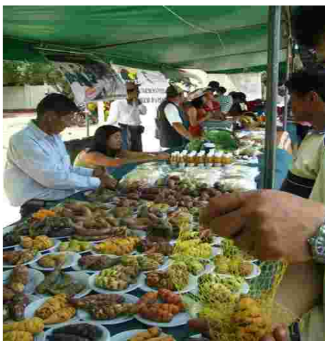
Presentación de variedades de tubérculos nativos: ocas, mashuas y arracachas.

En esta primera parte se desarrolló el VI Festival Nacional de la Agrobiodiversidad de Productos Ecológicos , en la que se congregaron productores representantes de todo el país para la exposición – venta de productos y transformados ecológicos y semillas de especies que representan la agrobiodiversidad peruana.